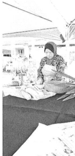
BAHAN TERBAIK: Tukang masak menyediakan bahan-bahan untuk bubur lambuk.