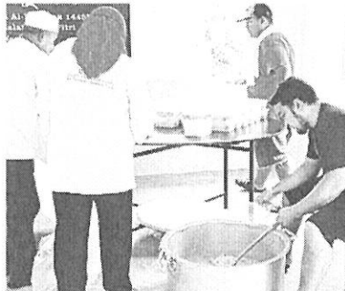
SEDIJA DIAGIH: Beberapa ahli jawatankuasa JKKK/KRT/PPB Kpg Demak Baru menyediakan bubur untuk diagih kepada orang ramai.