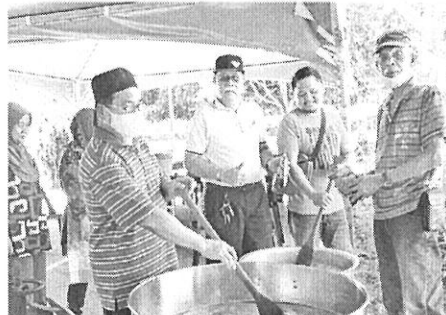
KERJASAMA: Ahli-ahli JKKK dan tukang masak menggaol bubur lambuk.