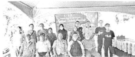
SEPAKAT: Ahli Jawatankuasa JKKK/KRT/KJM bergembira kenangan.