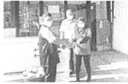
KONGSI REZEKI: Penyerahan bubur lambuk kepada staf stesen Petronas Jalan Kaka.