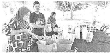
KEMAS: Bubur lambuk dihidupkan dalam bekas plastik oleh ahli jawatankuasa yang hadir.

memasak, menbungkus dan mengagah bubur di kawasan gotong-royong. Bubur tersebut diagihkan