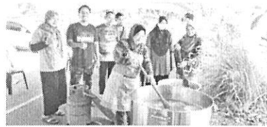
KEMBALI LAGI: Semangat gotong-royong memasak bubur lambuk.

Bagi Jawatankuasa Keselamatan dan Kemajuan Kampung (JKKK), Kawasan Rehatan (KRT) dan Parti Pemuda Bersatu (PPB) Kampung Demak Baru Fasa 1 di Kuching,